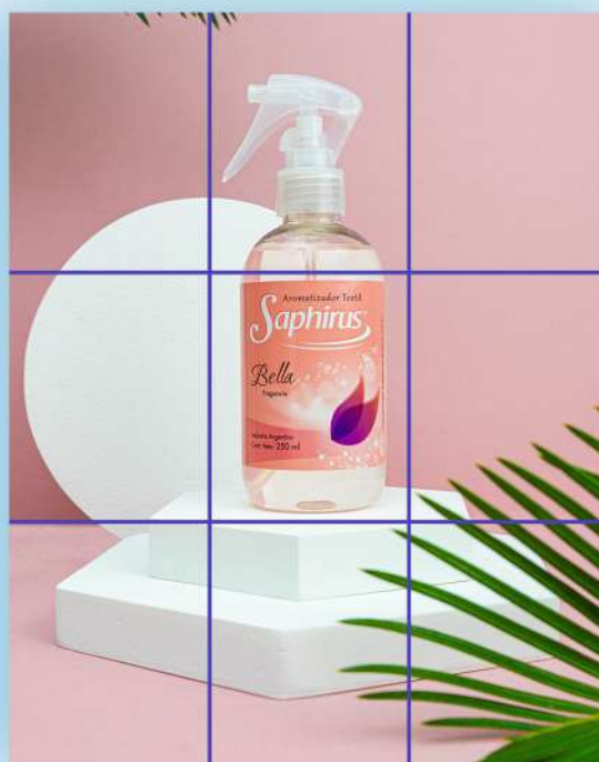
Horizonte sobre línea horizontal de abajo de la ley de tercios