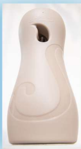
Altura no sugerida (cámara baja)