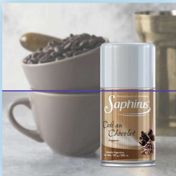
Horizonte en el centro

También puede ir en otros lugares, pero cuando no sepas donde ubicarla este tip puede ayudarte .