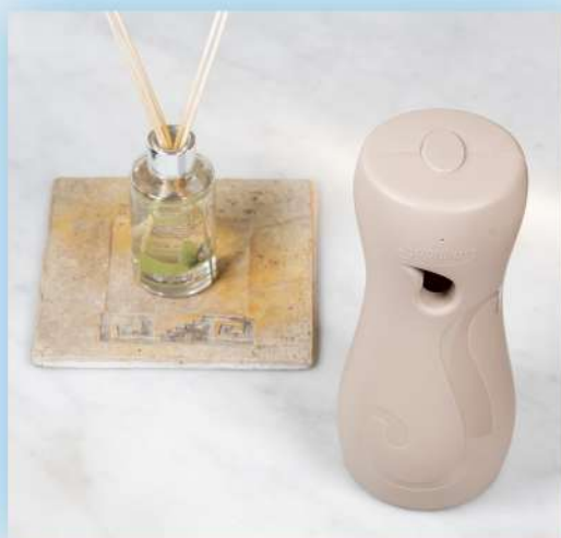
Altura no sugerida (cámara alta)

Cuando tomés fotografías de productos Saphirus, evitá hacerlo con la cámara por encima de ellos porque produce un efecto visual de pequeñez y parecen disminuidos . Hacerlo por debajo , tampoco es la mejor opción de registrarlos ya que pueden verse sus proporciones diferentes a las reales. Nuestra recomendación es tomar las fotografías con la cámara a la misma altura del artículo. Ésto hace que estemos en mejor sintonía con los objetos y el espectador los sienta más cercanos.