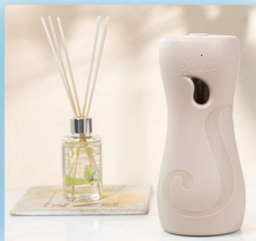
Altura sugerida (cámara al mismo nivel)